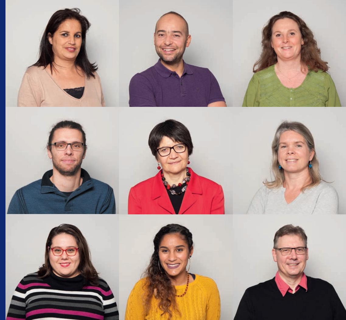
Sorbonne Université - Direction de la Communication - Novembre 2018

Travailler et faire reconnaître votre handicap Pourquoi ? Comment ?